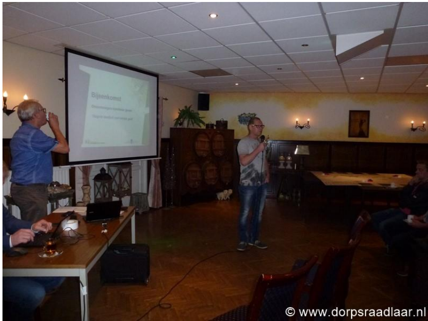
Toelichting van het plan.